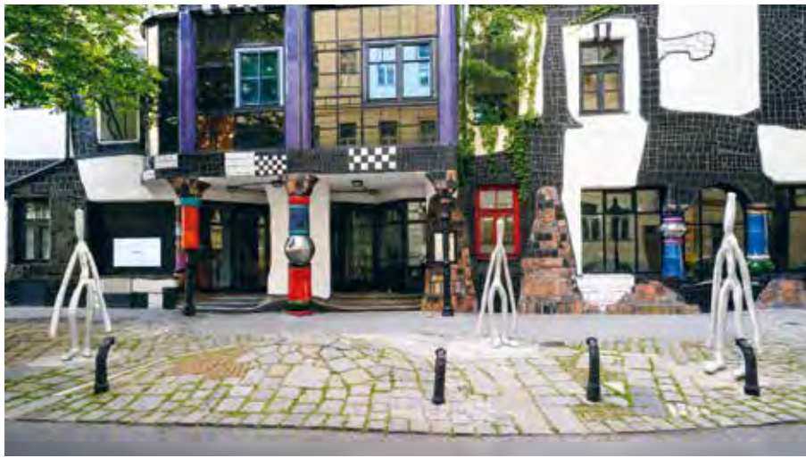
5 (Moving), 2023; One (Upright), Third (Upright), 2022 Aluminiumguss (poliert), je 220 x 60 x 60 cm cast aluminium (polished), each 220 x 60 x 60 cm

the world work?“ [Wie kann die Welt funktionieren?] (R. Buckminster Fuller) In ihrer Oberfläche spiegelt sich das Ich mit dem Anderen und der Umwelt; Gegensätze werden nivelliert. Wie sich äußere Einflüsse und ökologische Desaster auch in unsere humanoiden Körper einschreiben und deren Widerständigkeit auf die Probe stellen, ist eines der Grundthemen der Künstlerin.