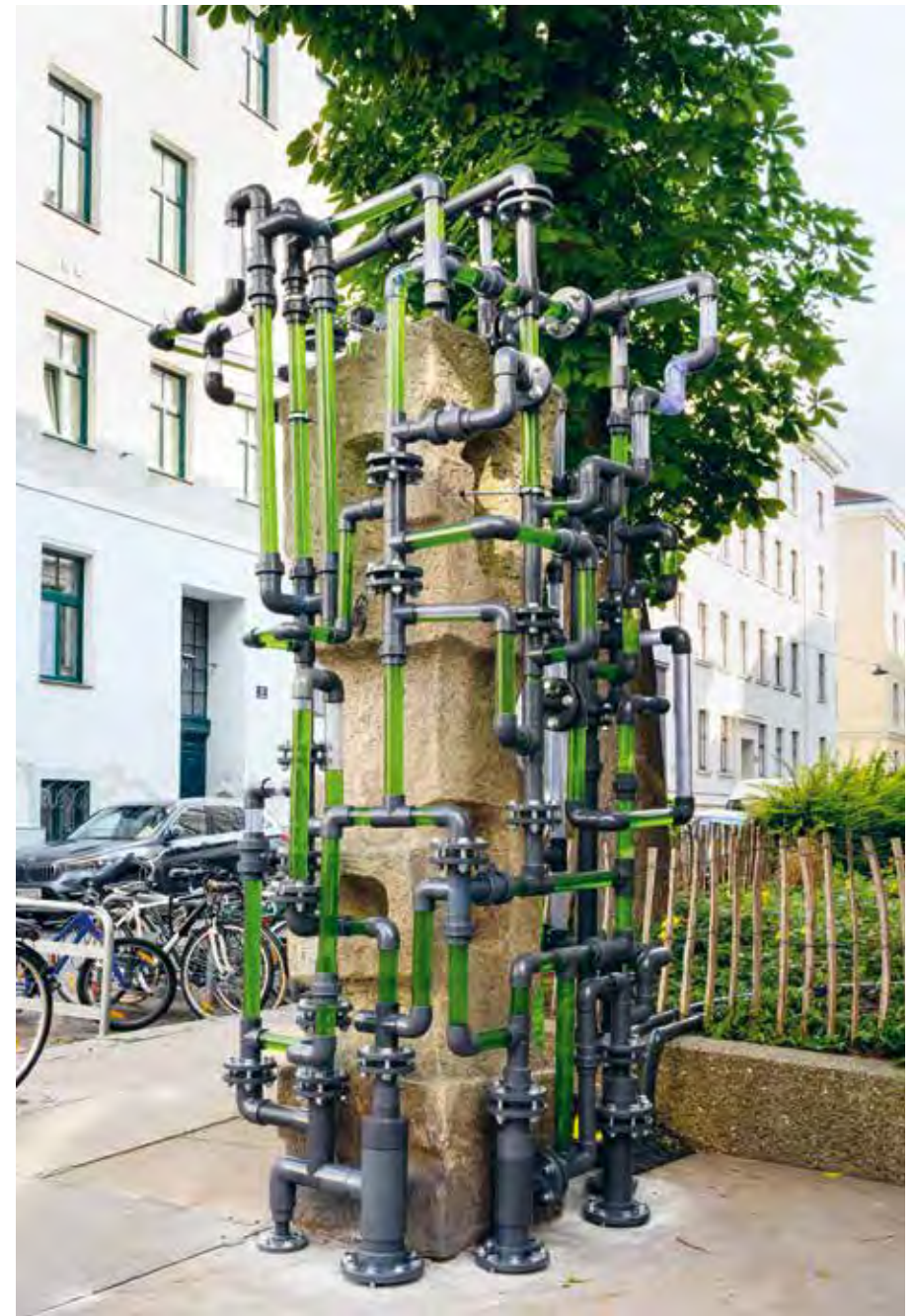
Epiphyt , 2023 PVC-Rohre, Pumpe, Wasser, Algen ( Chlorella vulgaris ), 298 x 120 x 120 cm PVC pipes, pump, water, algae ( Chlorella vulgaris ), 298 x 120 x 120 cm

"Epiphytes" are plants that grow on other plants. Aquatic epiphytes such as algae are not parasites; rather, they support and are a source of nutrients for many species. For the artist, considerations of self-sufficiency as well as nutritional facts were key in deciding what species of algae to choose. "Chlorella vulgaris" is characterised by a high mineral and protein content, one of the reasons why it has also become increasingly significant in economic terms. The unicellular spherical green alga is found around the world, occurs in freshwater and brackish water, in stagnant and flowing waters, and can be grown in large quantities. Supplying a growing global population with sufficient protein, fibre and minerals from microalgae such as these in the future is no longer the stuff of water-borne science fiction.