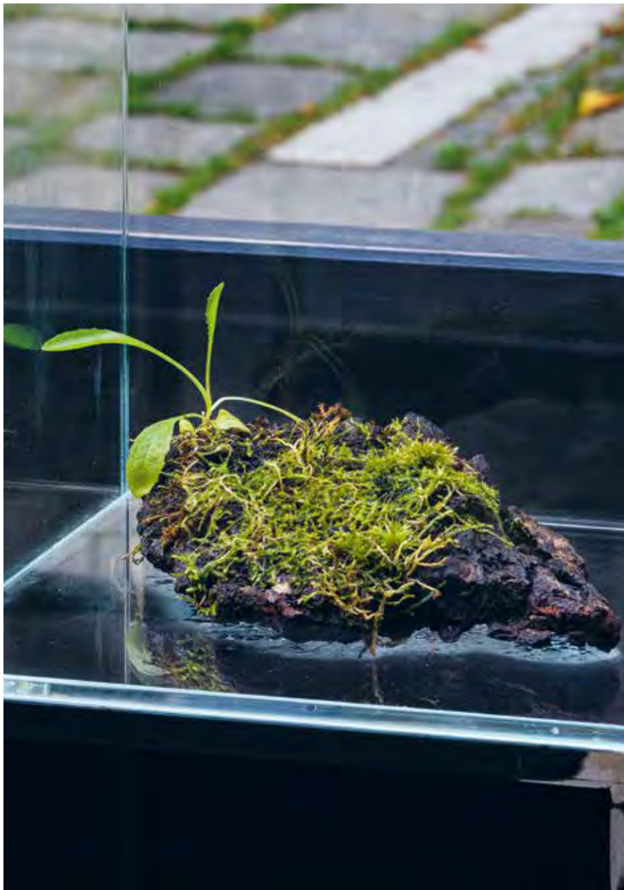
Blattvergesellschaftungen [Leaf Assemblages], 2023 Installation mit Fossilienkasten, Fernrohr, Vogelstange, Screen, Pflanzen, Stein und Holz, 220 x 600 x 160 cm Installation with fossil cabinet, telescope, perch, monitor, plants, stone and wood, 220 x 600 x 160 cm