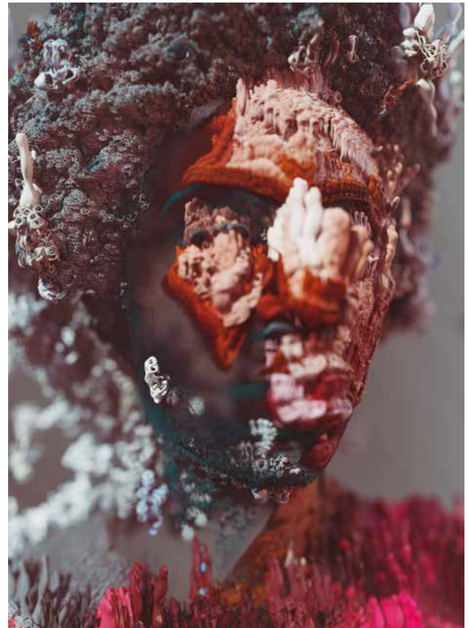
Flux Selves , 2023 Digitaldrucke, kaschiert auf Dibond, gerahmt, je 80 x 110 bzw. 40 x 55 cm Digital prints, mounted on Dibond plate, framed, each 80 x 110 and 40 x 55 cm

Each of the portraits tells a different story, drawing on speculative, fictional and personal tales and lending voice to both human and non-human subjects. The artist herself grew up between European and South American cultures