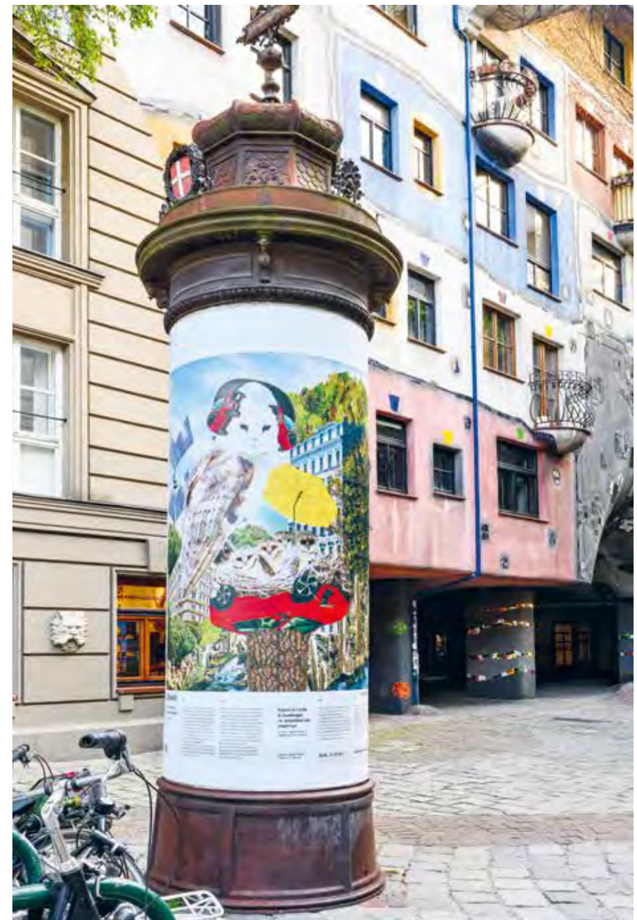
Klimakontingenz [Climate Contingency], 2023 Digitale Collage, Digitaldruck Digital collage, digital print

Vermont's brightly coloured climate collages explore what the urban space might look like in the future, in the face of global warming, and speculate with unexpected utopia. How are more and more people to live together sustainably in urban environments? How will we be living in the future, and what might an ecological housing complex look like? How will vegetation adapt to the changes