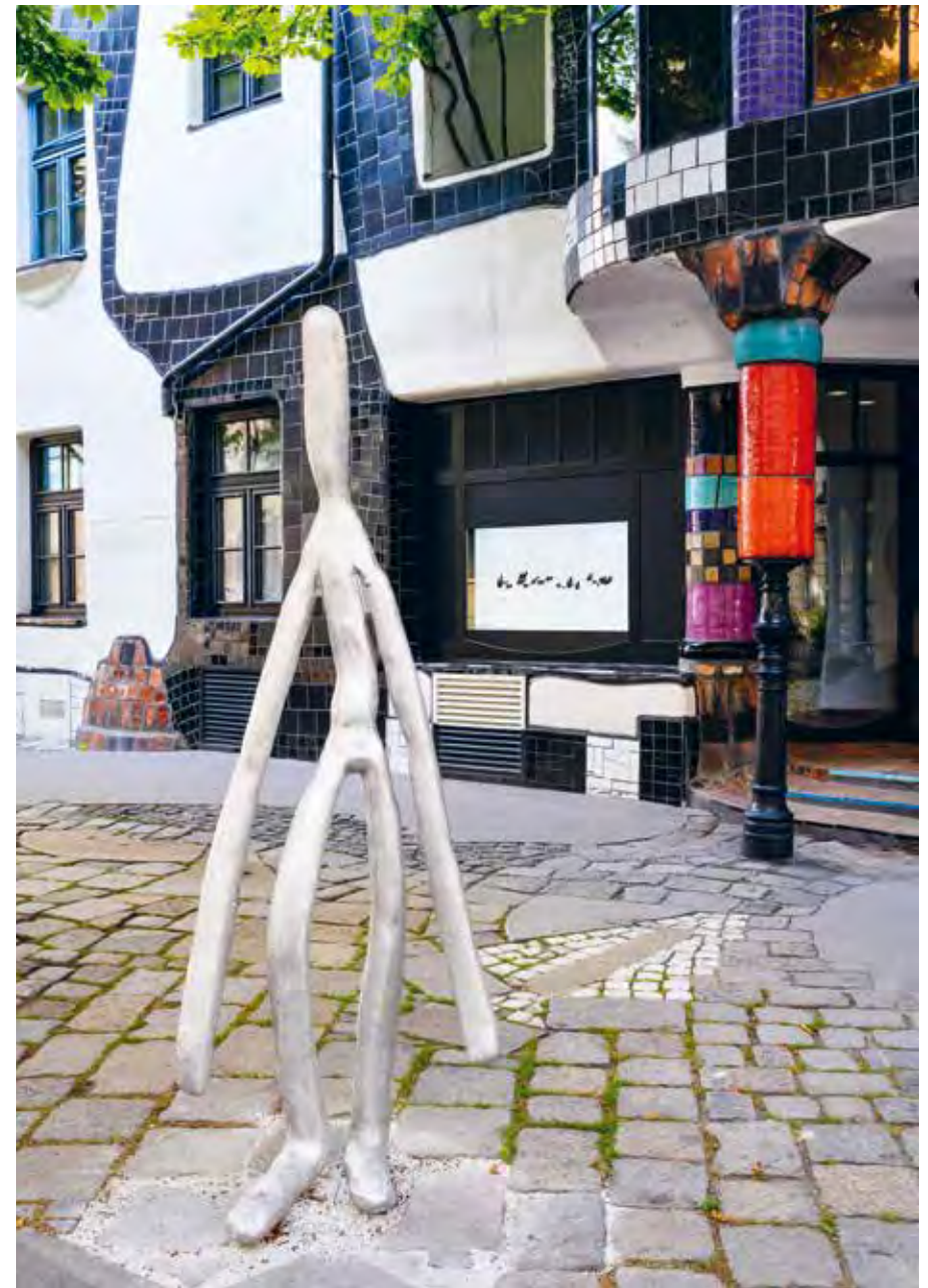
5 (Moving), 2023

* 1983 in Vienna, lives and works in Vienna.