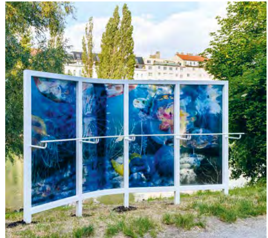
Belvedere , 2023

Hugo Canoilas's site-specific installation acts as a reality filter by superimposing the familiar view with a different perspective, creating an awareness of what is there, what is not there (any longer), and what could be there. His deep-sea panorama evokes a sense of