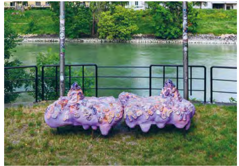
Terrestrial Stage, 2023

Amorphes Objekt mit keramischen Elementen, 65 x 250 x 100 cm Amorphous object with ceramic elements, 65 x 250 x 100 cm