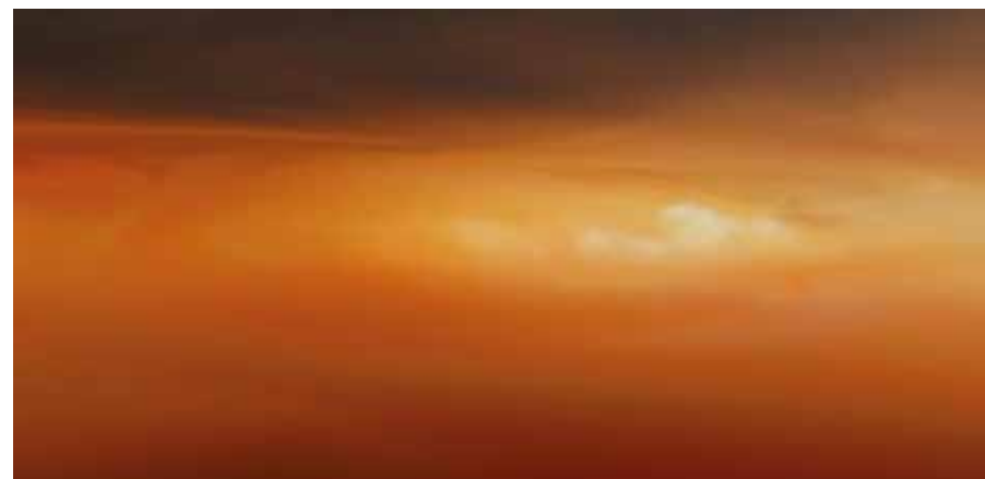
Titularium eines weit entfernten Himmelskörpers [Titularium of a Distant Celestial Body], 2023 Einkanalvideo, 12 min, Farbe, Ton mit englischen Untertiteln Single-channel video, 12 min, colour, sound with English subtitles

Interstellare Ökonomien und die Besiedlung des Weltraums sind keine Märchen, der Ausweg ins All ist spätestens dann vonnöten, wenn das Überleben der menschlichen Spezies tatsächlich auf dem Spiel steht. Die Wolken der (kosmischen) Gegenwart sind künstlich: Eine „zweite Natur“, wie sie längst auch für den irdischen Himmel verhandelt wird. BH