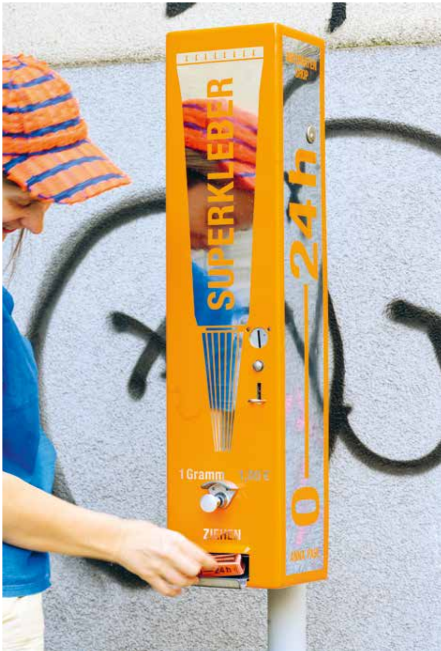
0—24h, 2023 Warenautomat, Metall, Lack, Superkleber, 140 x 15 x 17 cm Vending machine, metal, varnish, superglue, 140 x 15 x 17 cm

zu richten? Wodurch können wir die Gesellschaft zu mehr Handlungsbewusstsein aufrufen? Und wie können wir uns gemeinsam für eine klimagerechte Transformation einsetzen?