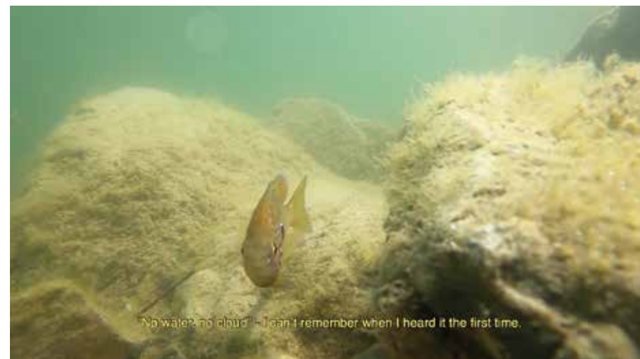
Suns of the Cloud, 2020

3-Kanal-Videoinstallation, 4 min 45 sek, Farbe, ohne Ton mit deutschen und englischen Untertiteln 3-channel video installation, 4 min 45 s, colour, without sound with German and English subtitles